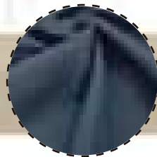
TECNOLOGÍA DRY FIT