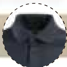
CUELLO CAMISERO 2 BOTONES