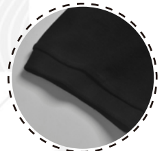
PUÑO AJUSTABLE EN TEJIDO RIB