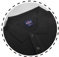
CUELLO CAMISERO DE DOS BOTONES