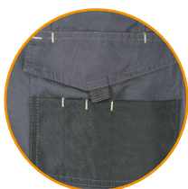
ZOOM BOLSILLO DERECHO