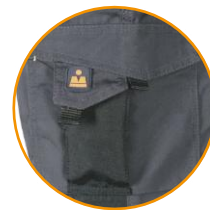
ZOOM BOLSILLO IZQUIERDO