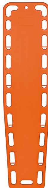
1- Camilla Orangeboard