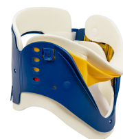
3- Cuello Cervical