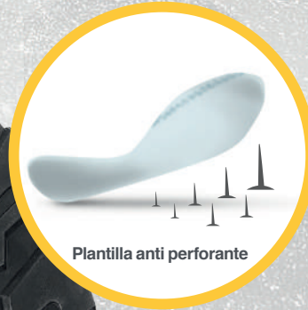
Plantilla anti perforante