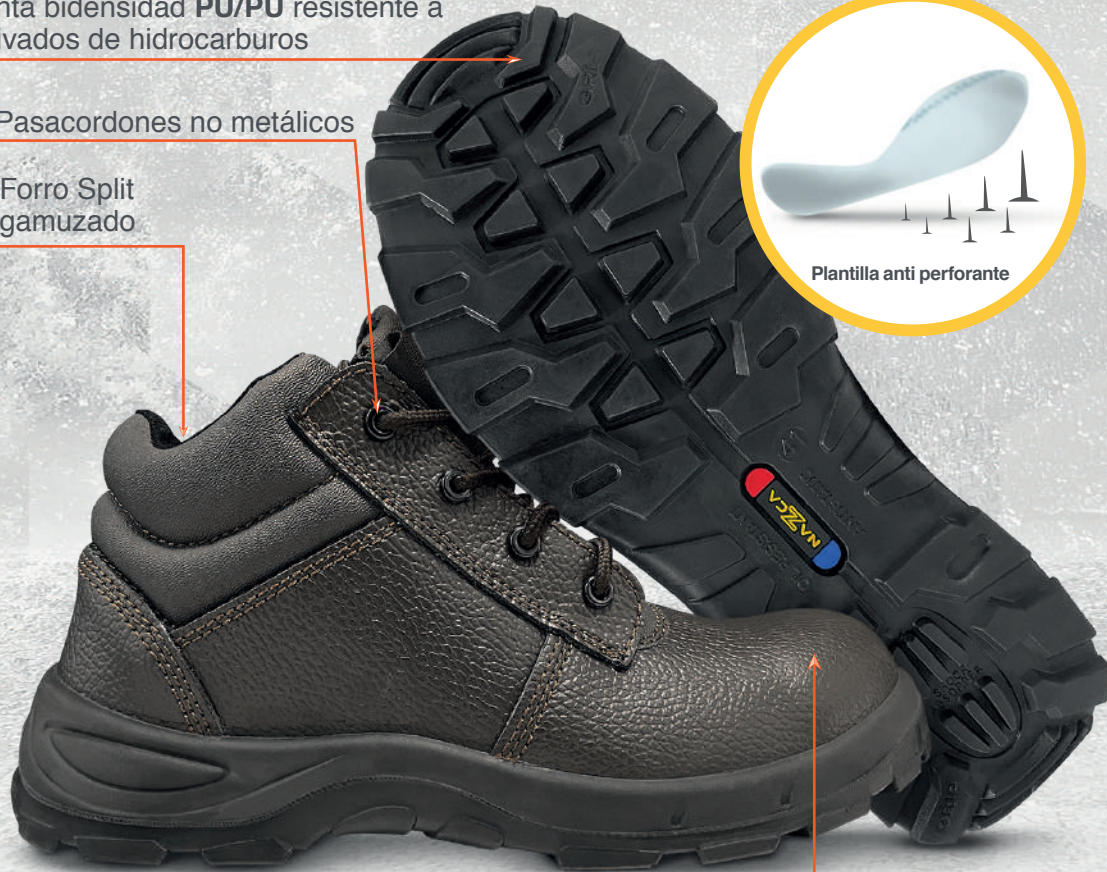
Puntera de acero templado