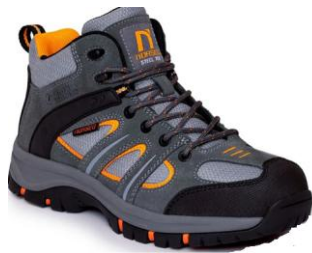
IMAGEN MODELO MANCHESTER ST

Cumple con el reglamento UE 2016/425 y es idéntico al EPP sujeto al certificado de la UE 0075/4873/161/12/23/2133 expedido por: